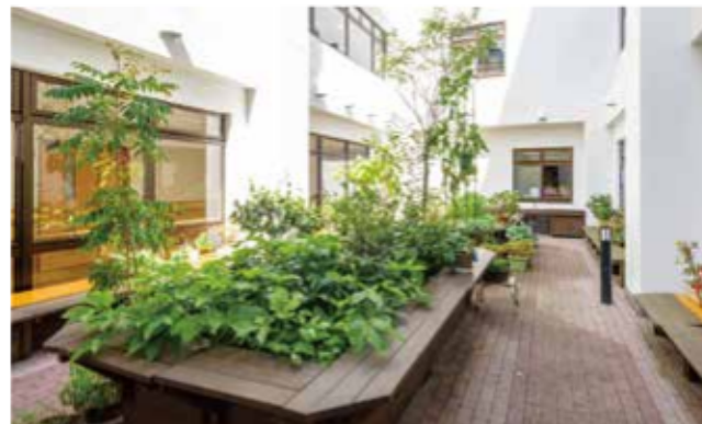
陽の光が注ぐ中庭は、季節の花々や野菜でいつも賑やか。