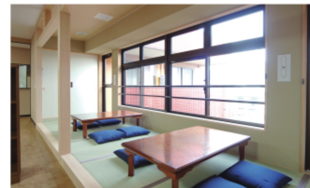
リビングルームには、ほっとひと息つける和室を設けています。