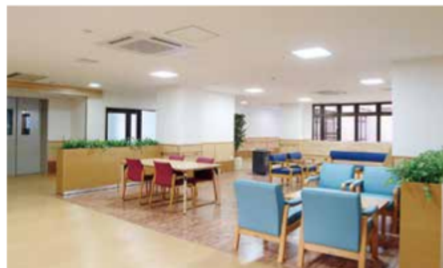
緑に囲まれたロビー。お待ち合わせなどにご利用ください。