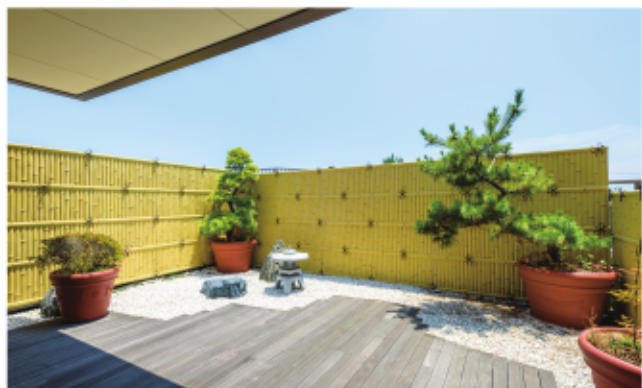
日本庭園を模した中庭。ゆくゆくは足湯も設置する予定です。