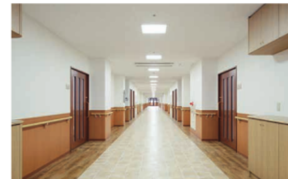
広々とした廊下は、車椅子でも安心して移動できます。