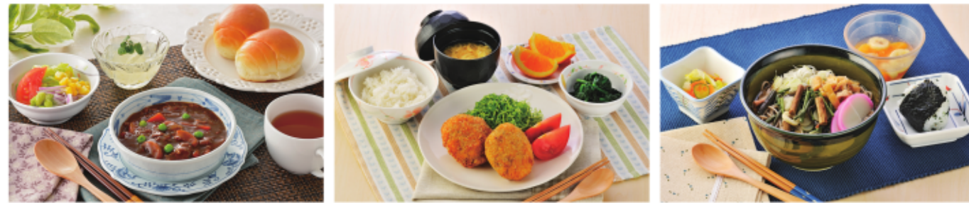
相模湾で獲れた海の幸や、旬の食材を使ったお食事をご用意しています。このお食事は実際にご利用者様にご提供しているものです。