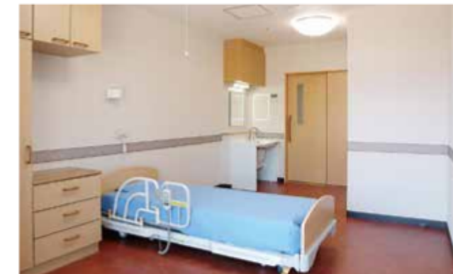
気兼ねなくお過ごしいただける、1名様用の居室。