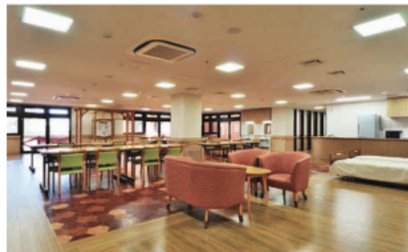
デイサービススペースでは、日々さまざまなイベントを実施。