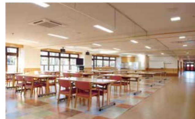
談笑しながらお食事を楽しめる食堂。