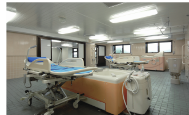
車椅子や寝たままの状態が入浴ができる特殊風呂も完備。