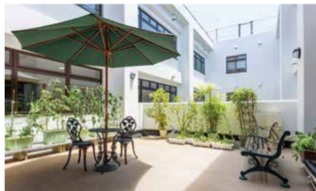
街なかのカフェのようなルーフバルコニーで贅沢なときを。