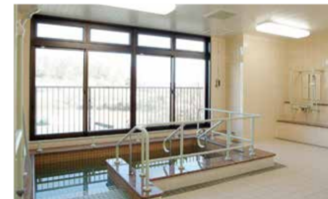
明るいバスルーム。もちろん特殊風呂も完備しています。