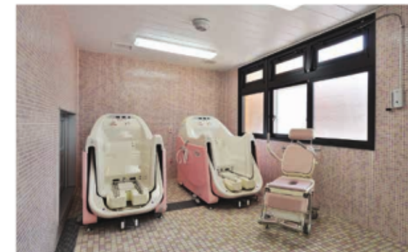
特殊風呂も完備しており、ご利用者様の状況に応じた入浴が可能。