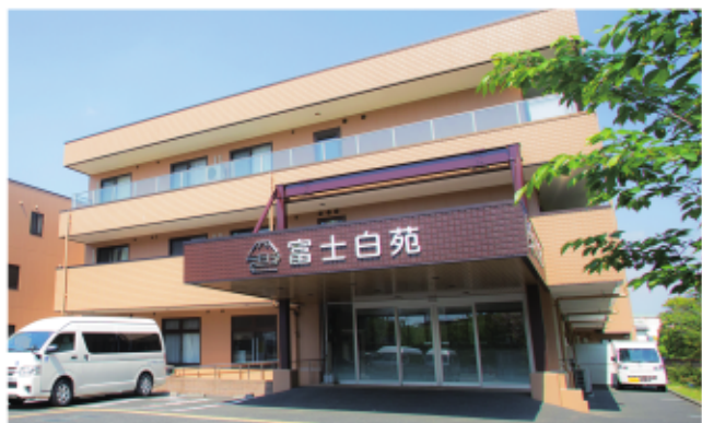
特別養護老人ホームが入っている棟の正面エントランス。

平塚市と大磯町の境にある平塚富士白苑は、海と山を同時に望める絶好のロケーション。屋上にのぼると目の前には相模湾が広がり、背後には緑豊かな湘南平が横たわっています。箱根駅伝や大磯花火大会などを間近で楽しめるのも、平塚富士白苑ならではの。