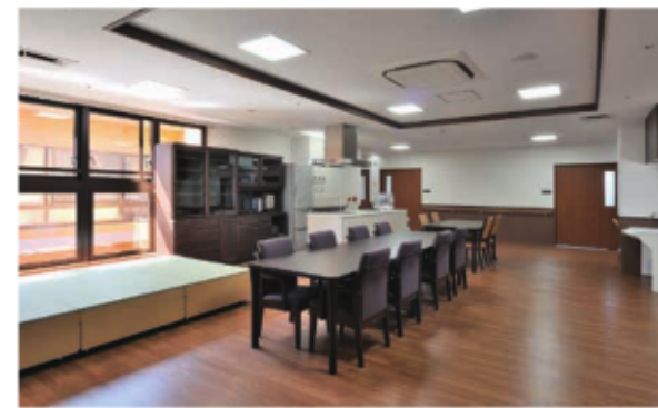
自宅のように使える、アットホームなリビング・ダイニング。

深い茶色を基調とした落ち着いた内装が、お一人おひとりの暮らしにそっと馴染みます。