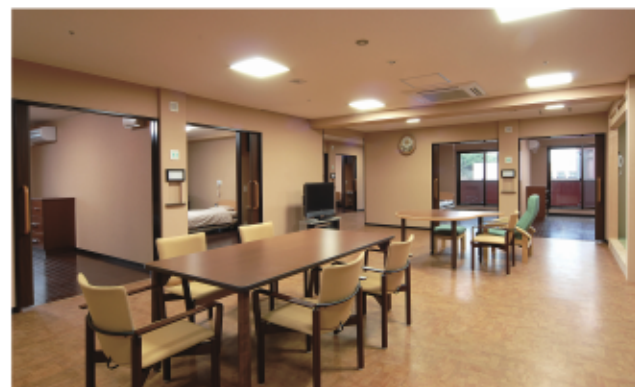
お食事や談笑にご利用いただけるリビングルーム。

居室はすべて個室タイプで、15㎡以上の広々とした空間を確保。自宅のようにくつろいでいただくため、使い慣れたご自身の家具を持ち込めるようにしています。茶色と白の清潔感あるデザインと、日差しをたっぷり取り込む大きな窓が特長です。