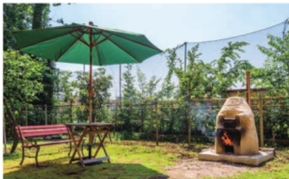
藤沢富士白苑の名物、石窯。ここで焼くパンやキッシュは最高！