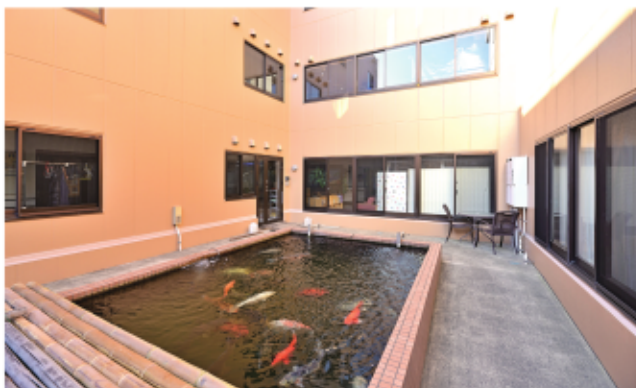
正面エントランスの傍には、錦鯉が泳ぐ池も。