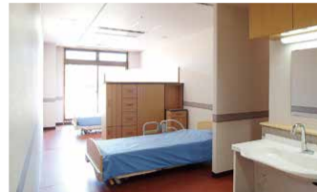
十分な広さを確保した、2名様用の居室。