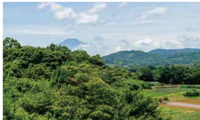
屋上からの眺め。晴れた日には富士山を望みながらリラックス。

2～3階には建物を一周できるベランダもあり、美しい景色に囲まれてのんびりお散歩を楽しめます。