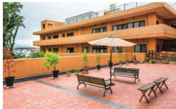
天気の良い日には、テラスのベンチで日向ぼっこやおしゃべりを。