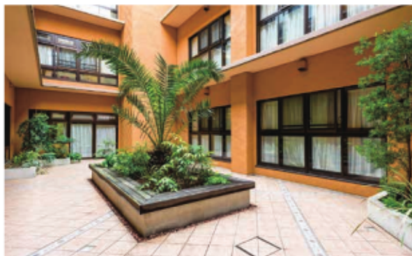
日差しが降り注ぐ中庭は、眺めるだけで開放的な気分。