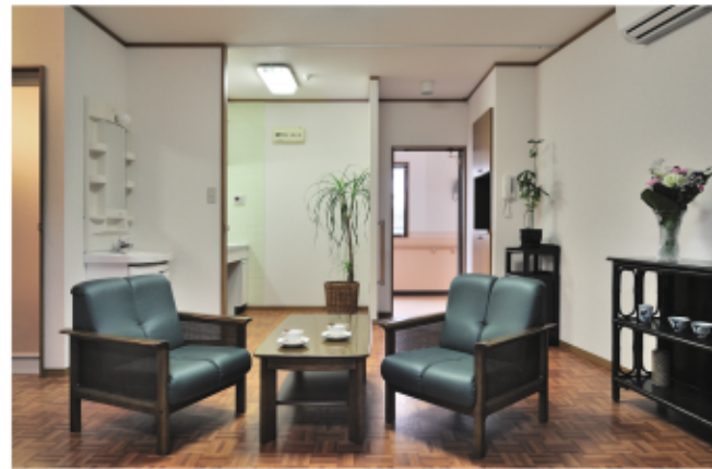
お好きな家具や調度品で、お部屋をアレンジしていただけます。

嘱託内科・消化器科・循環器科による診察(週1回) 心療内科・歯科・皮膚科・眼科による診察(必要に応じて) 定期健康診断 介護職員24時間体制 (玄関・ベッド横・バス・トイレにナースコール設置)