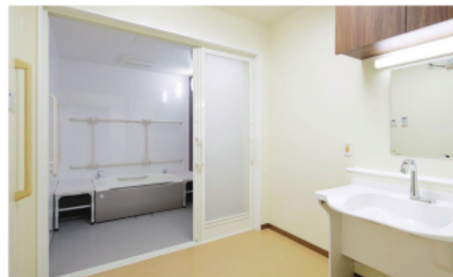
安全に配慮された設計で、リラックスできるバスルーム。