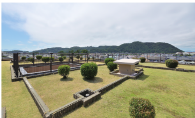
屋上は、海も山も見渡せる最高の眺め。