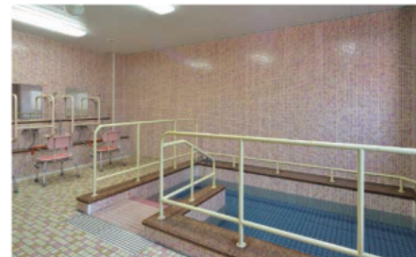
ゆっくりお湯に浸かりながら、心も体もリフレッシュ。